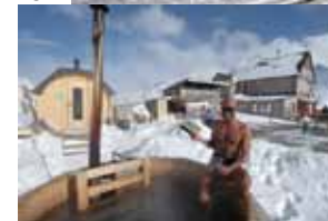
High Altitude Training