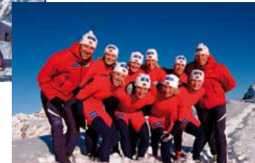
Norway National Nordicskiteam